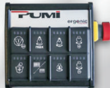
Elektrické ovládanie v kabíne