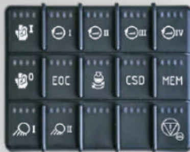
Elektrické ovládanie vzadu

Ovládanie je umiestnené v zadnej časti domiešavača. Je extrémne robustné a odolné proti znečisteniu. Páka ovládania rýchlosti bubna je vybavená bezkontaktným senzorom, ktorý je používaný aj v čerpadlách betónu.