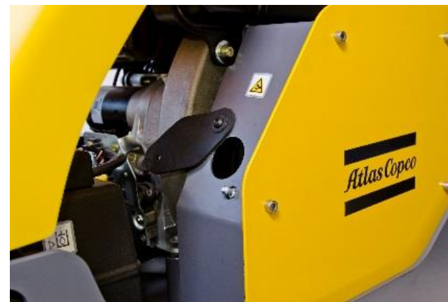
Prístup ku klinovému remeňu, kontrola napnutia