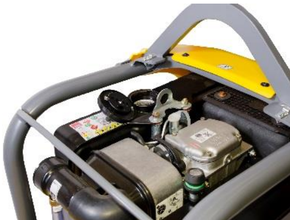
Prístup k palivovej mádrži