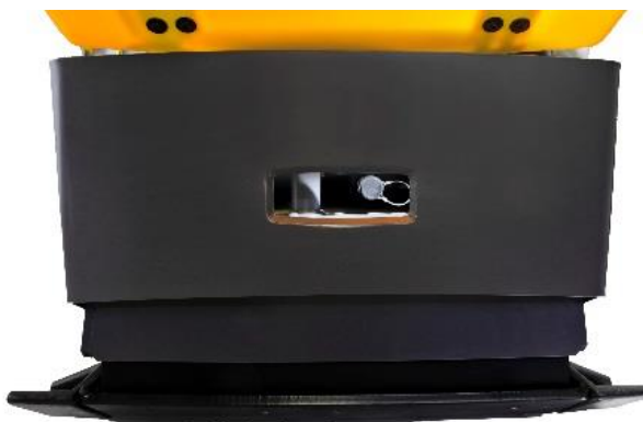
Jednoduchšia kontrola a výmena oleja v skrinke excentra