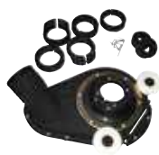
Prachový kryt pre 115 – 125 mm uhlovú brúsku