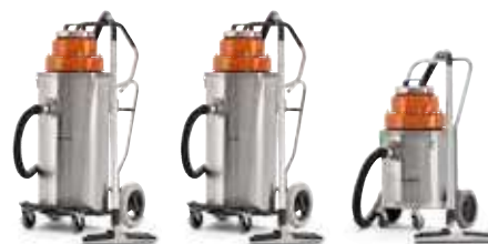
MOKRÉ POUŽITIE W 70 P W 70 W 250 P PRÍVOD VODY