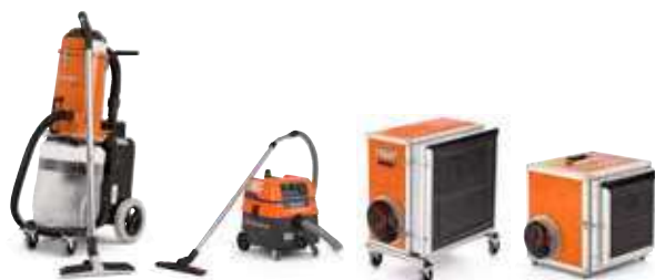
S 13 S 11 A 2000 A 1000