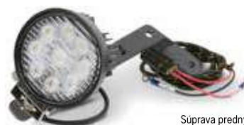
Súprava predných svetiel